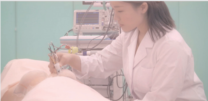
マイクロ波マンモグラフィ検査イメージ